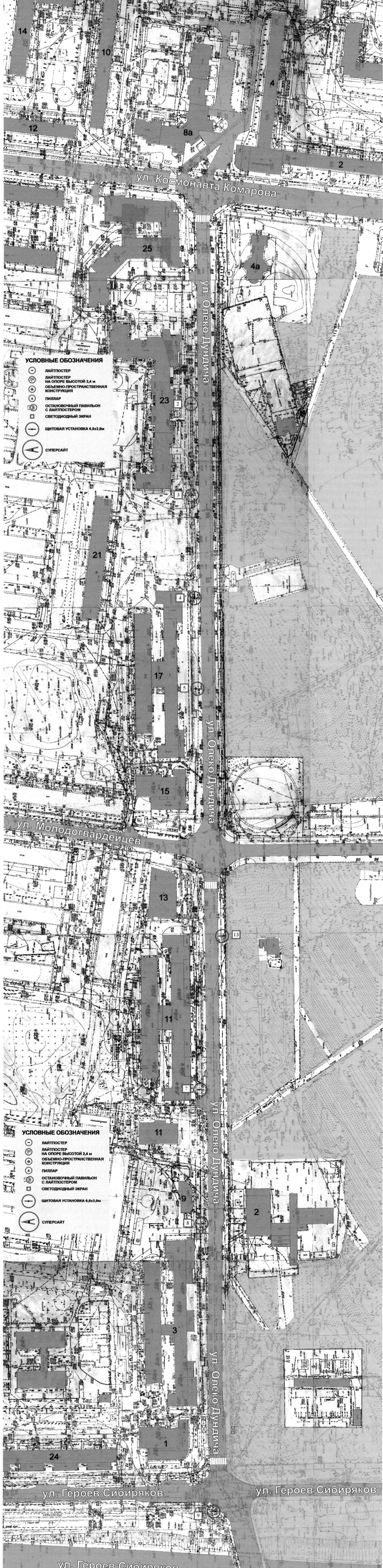
СХЕМА РАЗМЕЩЕНИЯ РЕКЛАМНЫХ КОНСТРУКЦИЙ НА ТЕРРИТОРИИ ГОРОДСКОГО ОКРУГА ГОРОД ВОРОНЕЖ ДЛЯ УЧАСТКА ТЕРРИТОРИИ: улица Олеко Дундича М 1:1000