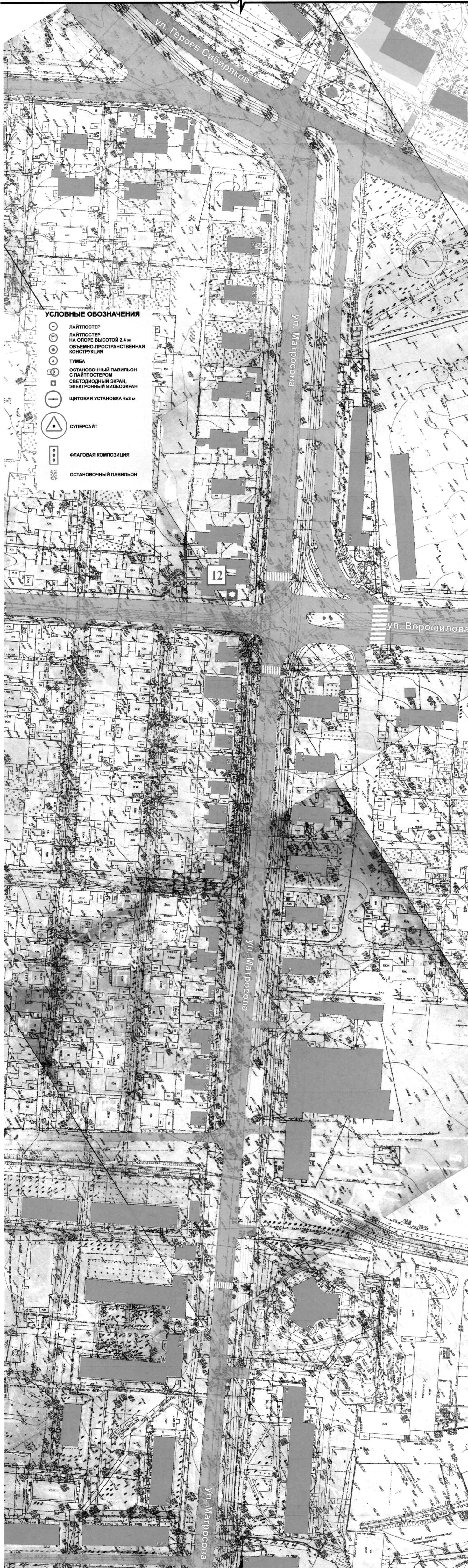
СХЕМА РАЗМЕЩЕНИЯ РЕКЛАМНЫХ КОНСТРУКЦИЙ НА ТЕРРИТОРИИ ГОРОДСКОГО ОКРУГА ГОРОД ВОРОНЕЖ ДЛЯ УЧАСТКА ТЕРРИТОРИИ: улица Матросова М 1:1000